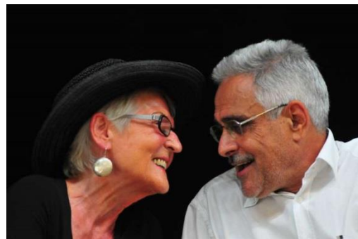
Herr Pleite (Kabarett)