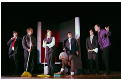
Senator am Boden („Kaligula“)