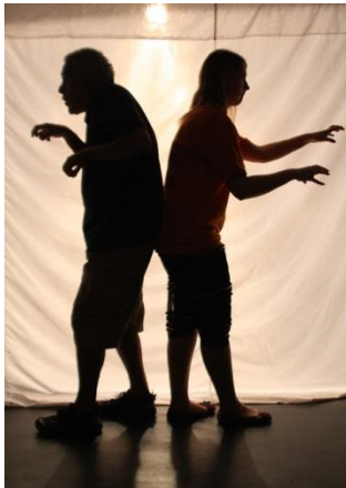
Truffaldino („Der Diener Zweier Herren“)