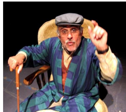
Der Großvater („O Tesouro“)